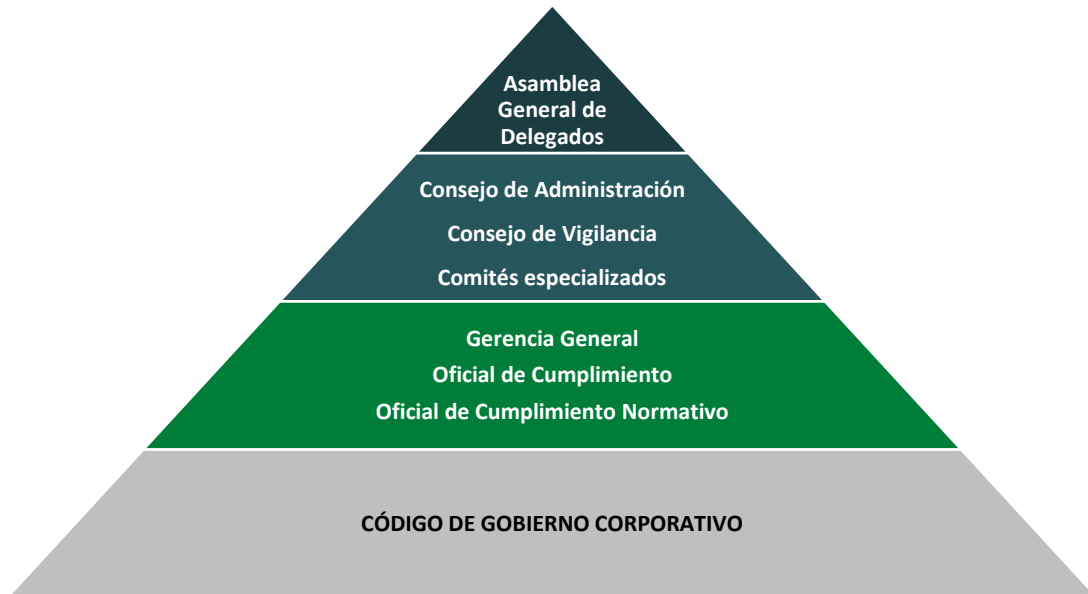
Figura N° 02. Estructura del Gobierno Corporativo